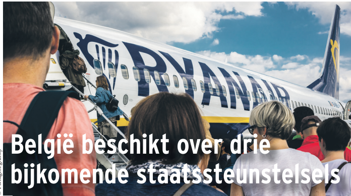
Ryanair heeft de Zweedse staatssteunregeling voor luchtvaartmaatschappijen met een Zweedse luchtvaartlicentie aangevochten.

De laatste weken keurde de Europese Commissie zeven Belgische coronastaatssteunstelsels goed. Zes van die stelsels beogen het verzekeren van voldoende liquiditeit voor ondernemingen. Het zevende stelsel verschilt van de andere, omdat het de bevordering van onderzoek en ontwikkeling tot doel heeft. Bijkomende steunmaatregelen kunnen worden verwacht.