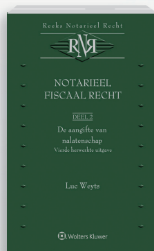
Notarieel Fiscaal Recht Deel 2: De aangifte van nalatenschap