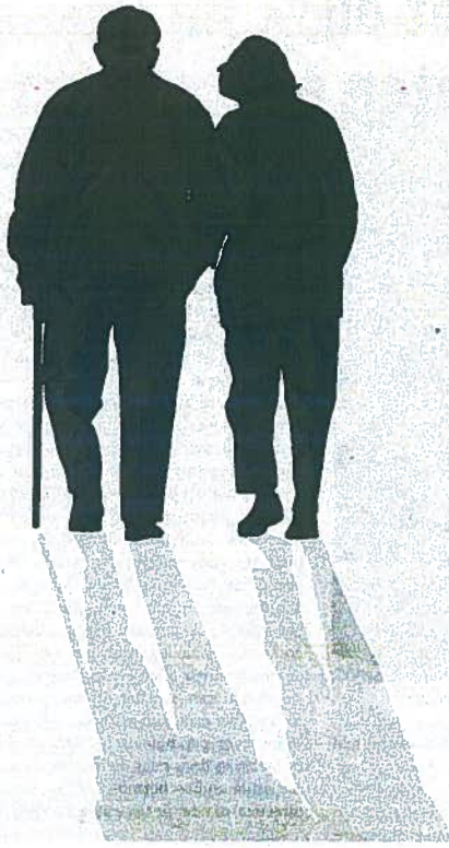
Volgens de verzekeraars zal dit leiden tot fors duurder levensverzekeringen op de Belgische markt.

Door de premie te baseren op al die factoren zorgt de verzekeraar ervoor dat kandidaat-verzekerden van de naar eigen inzichten statistisch gegroepeerde 'goede risico's' een lagere premie betalen dan kandidaat-verzekerden